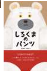
しろくまのパンツ(ブロンズ新社)