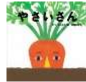
やさいさん (学研プラス)