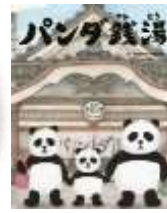
パンダ銭湯(絵本館)