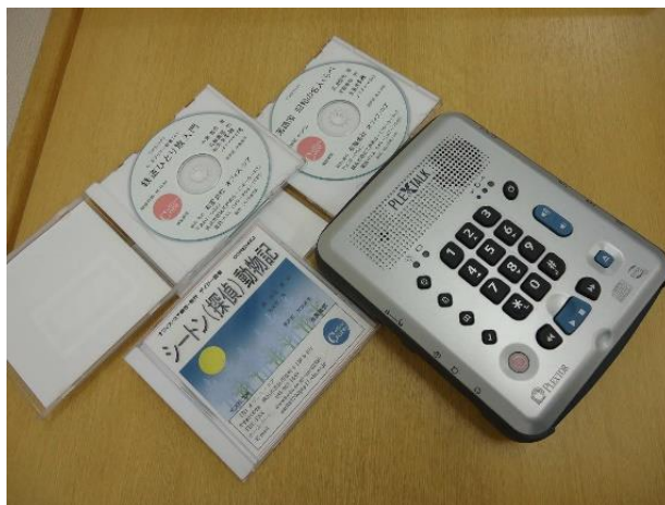
で い じ - さ い せ い せ ん よ う き き DAISY再生専用機器『プレクストーク』

い す み し ざ い じ ゅ う か た せ ん よ う き き こ う に ゆ う ば あ い し き ゅ う ぶ 和泉市在住の方が専用機器を購入する場合、市から給付を う 受けることができますので(自己負担1割)、市役所障がい ふ く し か そ う だ ん で ん わ 福祉課にご相談ください。(電話：99-8133)